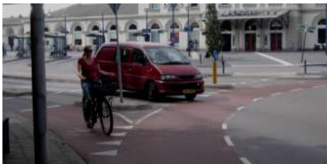
Rondell i Zwolle